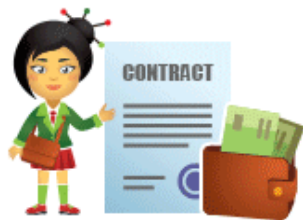
Обучение по контракту