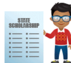
Обучение по квоте (бюджет)