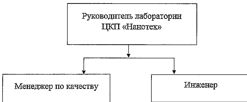
Рисунок 1 – Организационная структура лаборатории ЦКП «НАНОТЕХ» УГАТУ

3.3 Штатное расписание лаборатории ЦКП «НАНОТЕХ» УГАТУ утверждается приказом ректора. Организационная структура лаборатории ЦКП «НАНОТЕХ» УГАТУ представлена на рисунке 1.